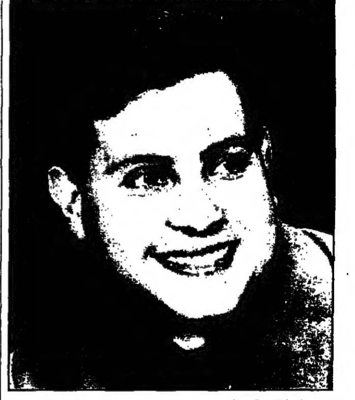
هاني شاكرفي جرش